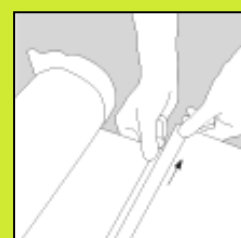
Changement de visuel facile