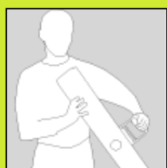
La poignée sert de base

Ce n'est pas du luxe de pouvoir compter sur L'ORIGINAL duo.jump